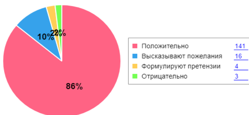
Как родители оценивают детский сад

Вывод: Результаты педагогического анализа показывают преобладание детей с высоким и средним уровнями развития при прогрессирующей динамике на конец учебного года, что говорит о результативности образовательной деятельности в Детском саду.